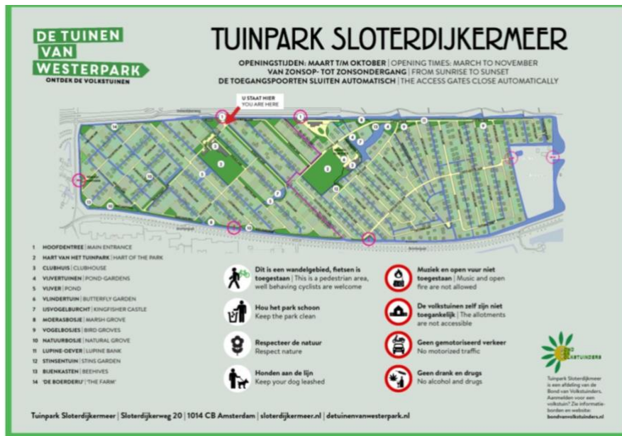
Informatiebord toegankelijkheid tuinparken Westerpark

Daarop staat per tuinpark het bezoekadres, de openingstijden en wat het voor bezoekers aan bezoekers te bieden heeft.